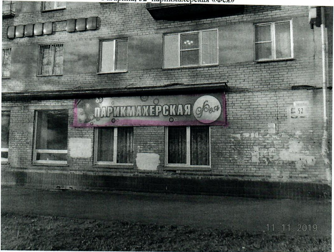
Гагарина, 52 парикмахерская «Фея»